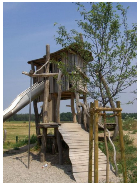
und Ottorsheim, Fotos © Naturspur ev.

Deshalb eine Bitte an alle Jugendlicher: Die Neugestaltung ist nur zu stemmen, wenn viele mit Hand anlegen. Bitte helfen Sie also mit, wenn der Kindertagenausschuss dazu aufruft. Vielleicht kann auch der eine oder andere Sachspenden einbringen oder Fahrdienste leisten.