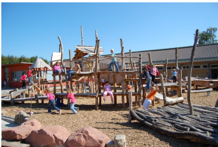
Von Naturspur gestalteter Spielplätze in Lustadt ...

Die Umsetzung wird nach Maßgabe, unter Anleitung und mit Begleitung von Naturspur in mehreren Teilprojekten erfolgen. Zumindest eines dieser Teilprojekte soll in 2011 gestartet und beendet werden.